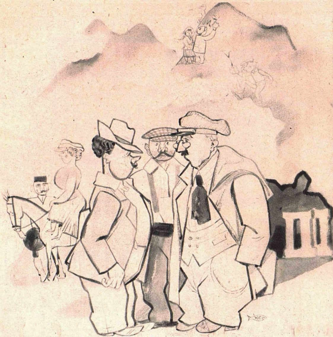
Рис. Ю. Ганфа

— Завидую людям! Отдыхают, гуляют! А я—мучаюсь по жаре в командировке от Кожтреста—изучаю качество подошвы... этой горы!