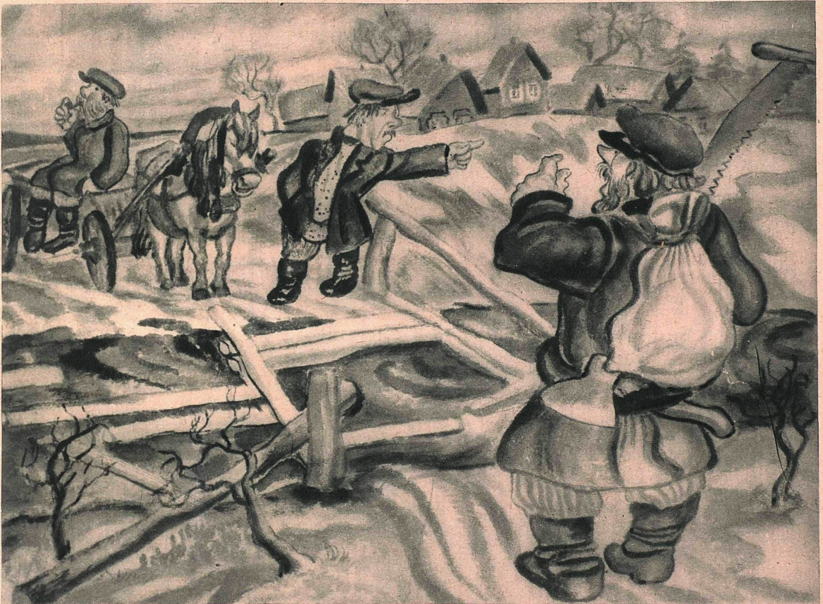
Рис. И. Каликина.

От деревни недалечко По оврагу вьется речка. Пустяковая река,— А поди ж ты—глубока!