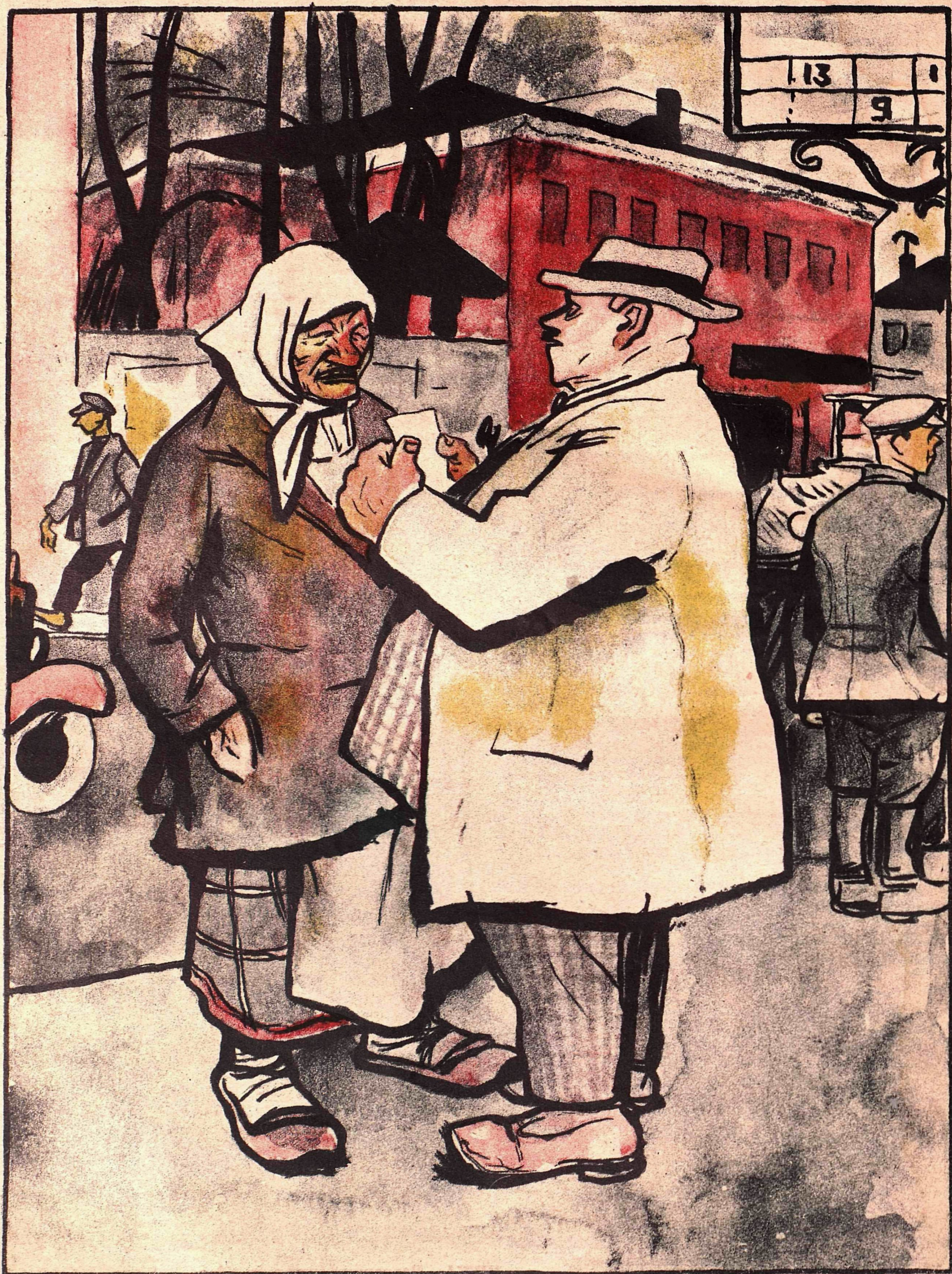
Рис. И. Малютина

— Так тебе мануфактуру?! Прямо по этой улице, потом направо. На углу — кооператив „Коммунар“. — „Знаю, батюшка!“ — От этого „Коммунара“ налево — мануфактурный магазин ЕПО. — „Знаю, батюшка“. — Ну, вот! Рядом с ним — частный магазин. Там и достанешь.