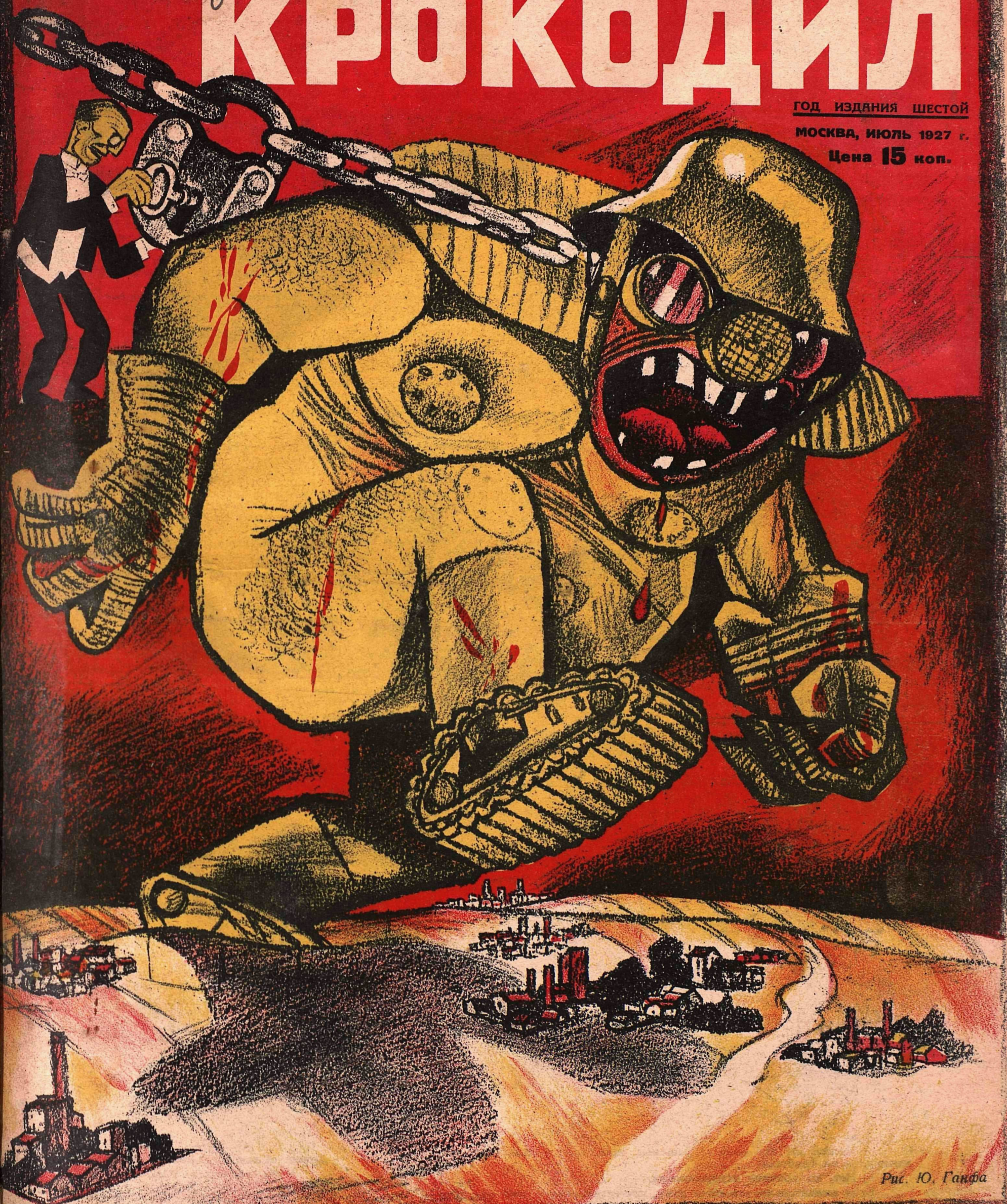
Рис. Ю. Гагара