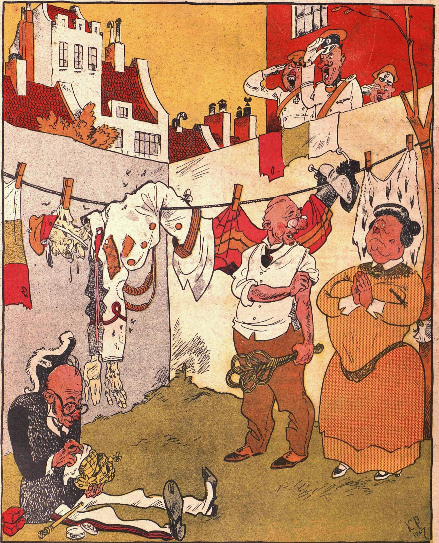
Рис. К. Ротова

— Ради бога, осторожней! Его один раз уже так неосторожно выбили!