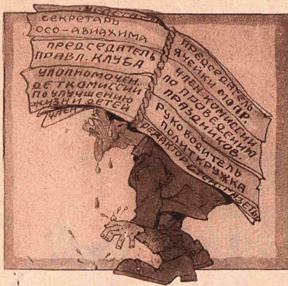
Рис. Г. Ликман

— Ффу! Чижало! Посидеть, разве, отдохнуть?