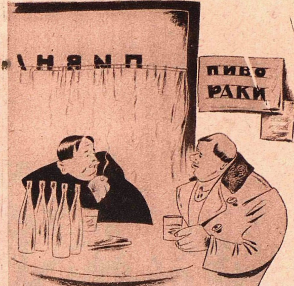
Рис. Як. Завьялова

— Нынче меня жена послала туда, где раки зимуют. Я и пришел прямо сюда.