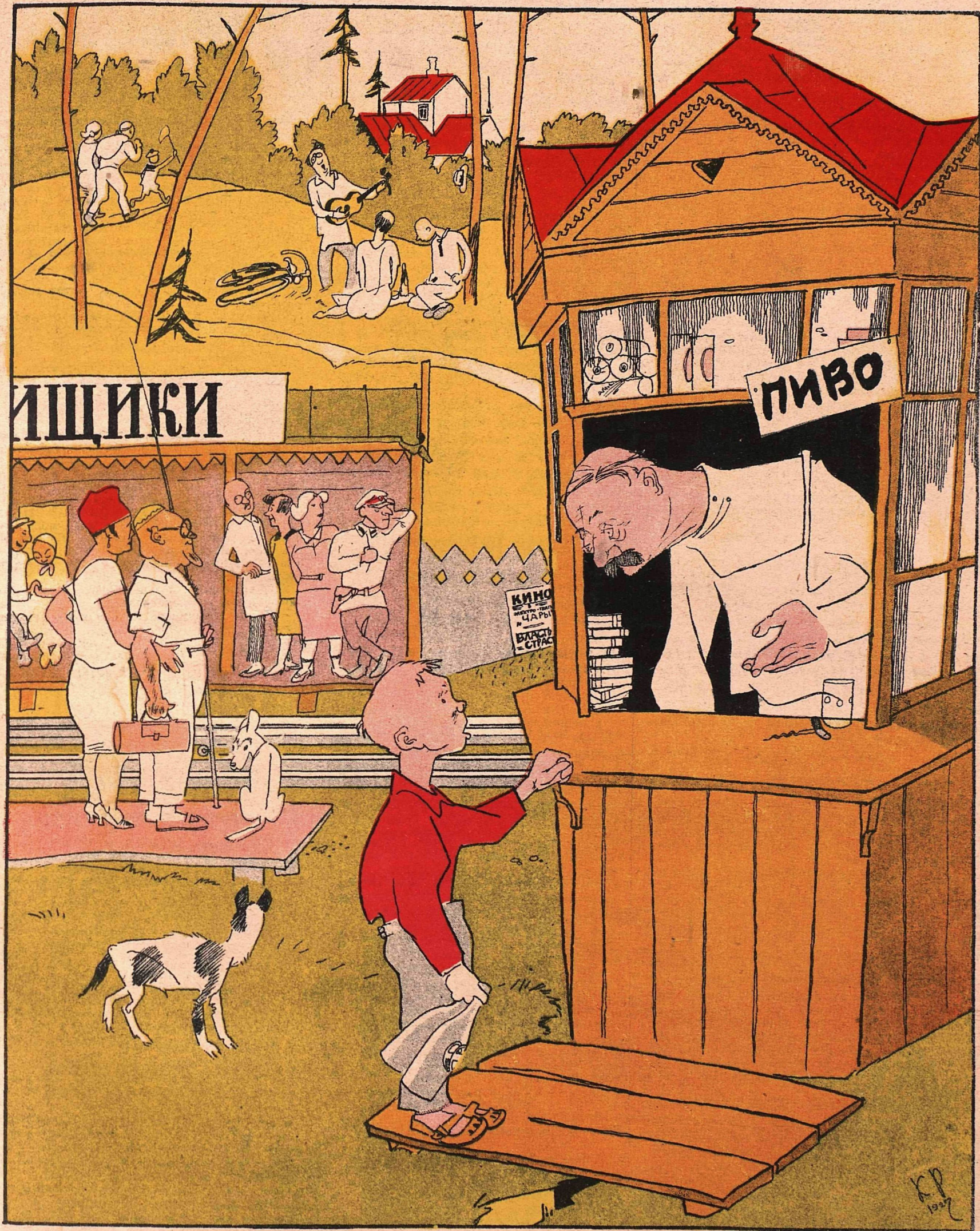
Рис. К. Ротова

— Куда тебя, пузыря, за четырьмя бутылками посылают?! Ты же не донесешь! — А я, дяденька, две тут выпью.