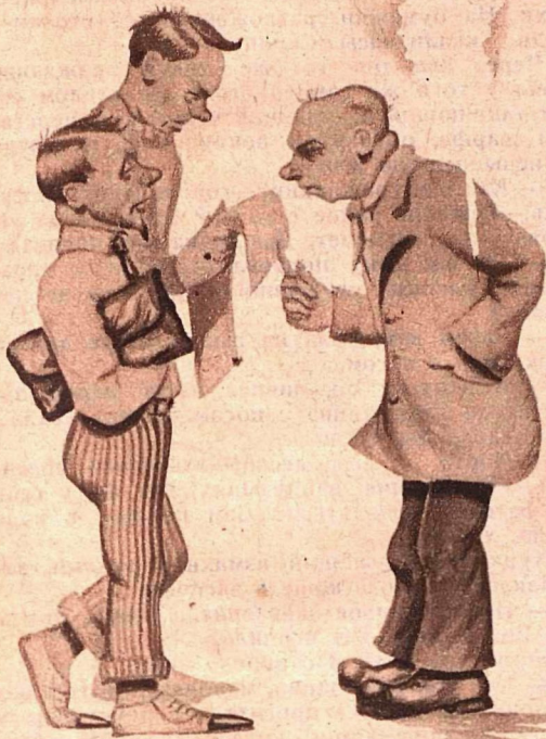
Рис. Б. Кузьмина

— Почему ты в конкурсе „Крокодила“ не участвуешь?