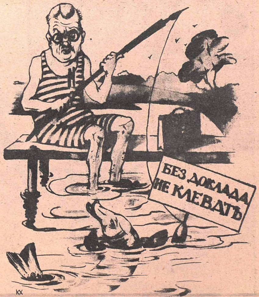
Рис. К. Хомзе, по конкурсной теме Б. Матвеева